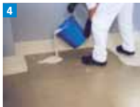
4 Auf der Fläche Abdichtungsharz satt vorlegen.