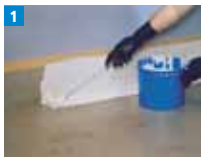
1 Abdichtungsharz satt vorlegen.

Beginnen Sie mit den Aufkantungen und arbeiten Sie Innen- und Außenecke gemäß Verarbeitungsanleitung aus.