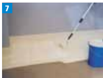
7 Das eingelegte Vlies mit einer ausreichenden Lage Harz abdecken.