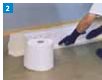
2 Triflex Spezialvlies in das vorgelegte Material blasenfrei einarbeiten.