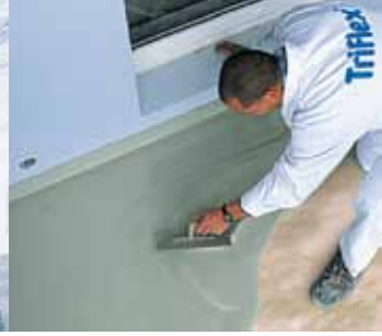
Triflex Flüssigkunststoff – Einfache Verarbeitung