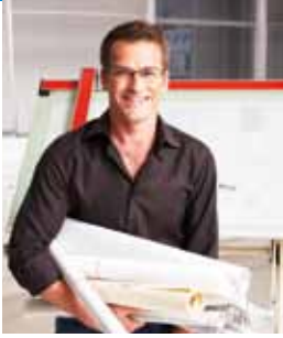
Triflex – Da bin ich mir sicher!