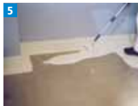
5 Mit einer Fellwalze gleichmäßig auftragen.