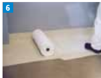
6 Triflex Spezialvlies in das vorgelegte Material blasenfrei einlegen.